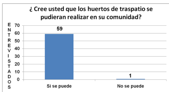
Gráfica 1 Elaboración propia con datos de campo.

De los 60 entrevistados, 59 aseguraron que si se puede llevar a cabo la elaboración de huertos de traspatio, solo uno menciona que no se puede.