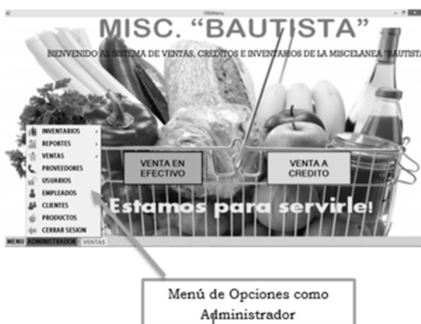
Figura 2. Menú principal, sistema punto de venta

La interfaz principal del sistema inventario y venta (figura 2) muestra los módulos mencionados anteriormente; así como, el Catálogo web (figura 3).