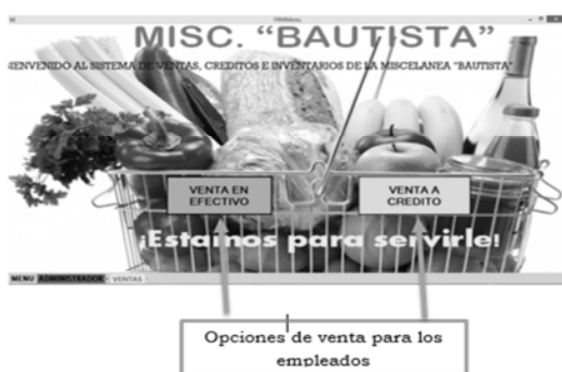
Figura 3. Menú Principal, Catálogo Web